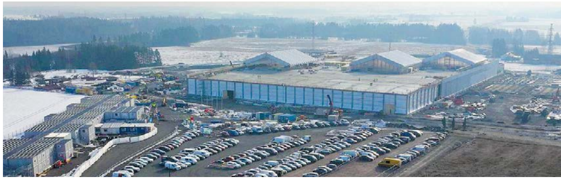
Hypercon ja DayOnen yhteishanke Koriolla on hyvässä vauhdissa. Harjakaisia juhliittiin toukokuun alkupuolella ja datakeskus on siirtymässä rekrytointivaiheeseen.

Rakenteilla olevien kampusten työllisyysvaikutus on merkittävä. Tavoitteena on, että datakeskusten yhteyteen syntyy muuta teol-