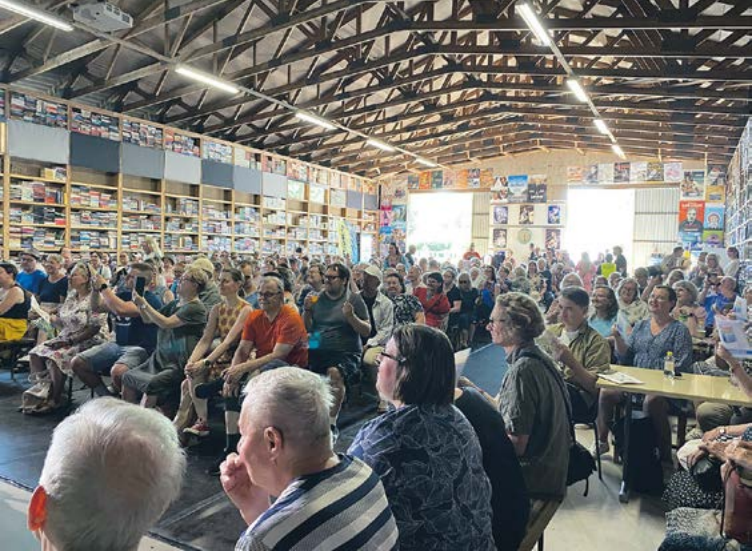
Wanha kirjahalli ja kirjaseinät ovat jo itsessään nähtävyyksiä. Kuva vuoden 2025 Dekkaripäiviltä.