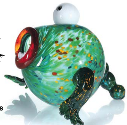
Johannes Rantasalo, Kolpo, 2025, kuumana muovattu lasi.