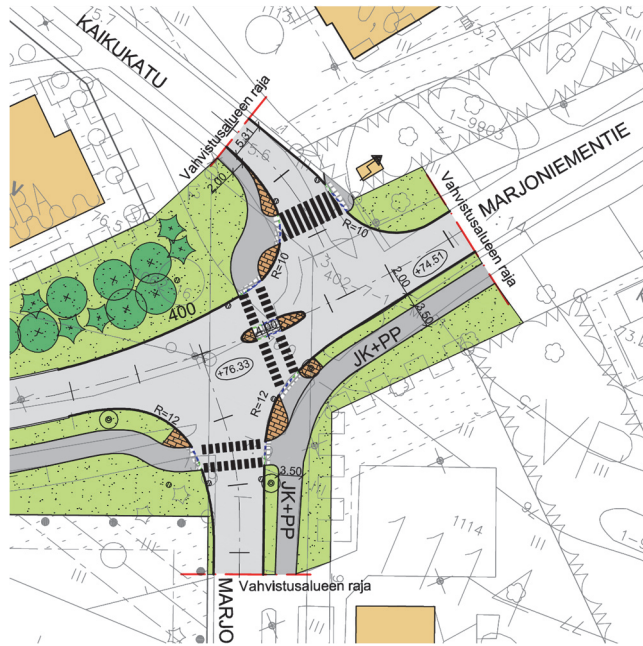
Kuva 4. Ote Kasarminkadun, Kaikukadun ja Marjoniementien liittymän katusuunnitelmasta suunnittelualan kohdalta.

Lisäksi selvityksessä on ehdotettu osin vaihtoehtoisia toimenpiteitä liikenneturvallisuuden parantamiseksi: