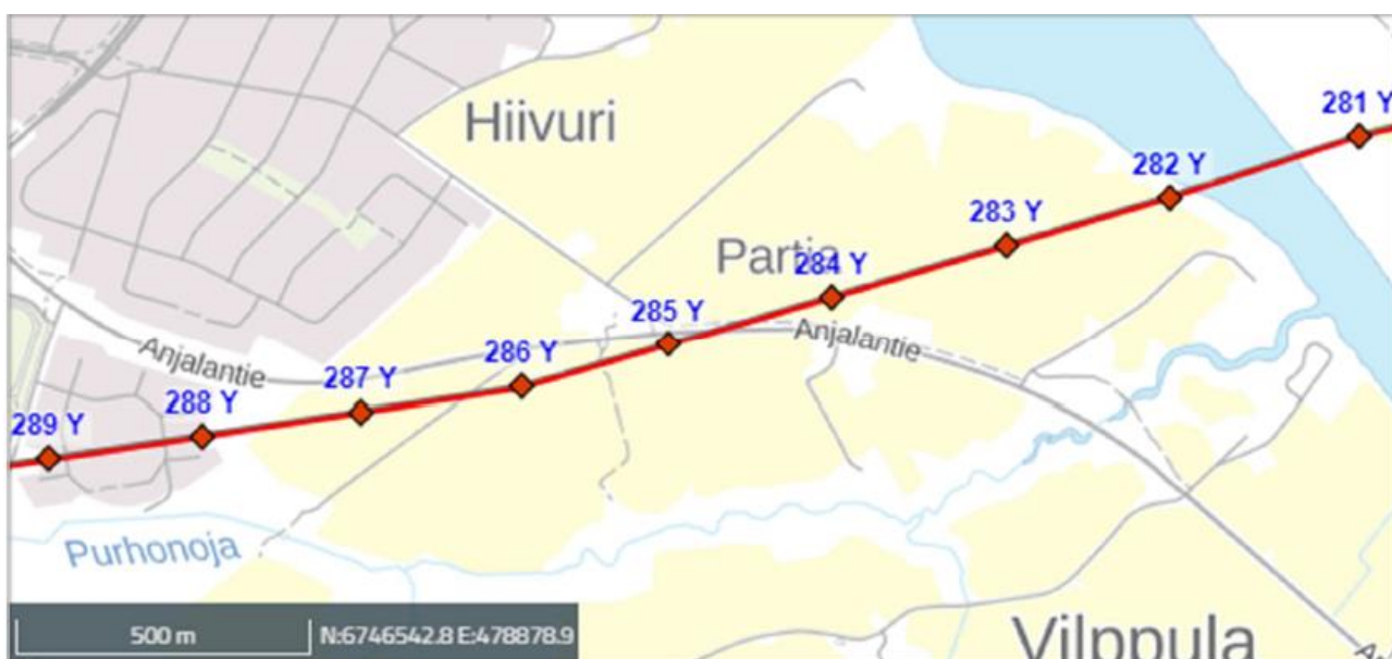
Kuva 1. Fingridin 110 kV voimajohto Yllikkälä - Koria.

Alueelle sijoittuu Fingridin 110 kV (kilovoltin) voimajohto Yllikkälä – Koria (suunnittelutunnus 1985) samassa pylväsrakenteessa KSS Verkon 110 kV voimajohdon kanssa. 2x110 kV voimajohtoalue koostuu 26 metriä leveästä johtouukeasta ja 10 metriä leveistä reunavyöhykkeistä. Rakennusrajoitusta merkitsevät rakennusrajat kattavat koko voimajohtoalueen (sijoittuen 23 metrin etäisyydelle voimajohdon keskilinjasta).