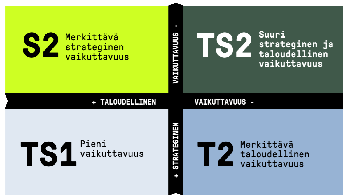
Kuvio 2 Hankintojen luokittelu strategisen ja taloudellisen vaikuttavuuden perusteella sekä toimintaohjeistus luokittelun mukaan.

Strategiset hankinnat ovat kaupungin toiminnan ja tuoksellisuuden kannalta olennaisia. Niissä kaupungilla on huomattava taloudellinen ja toiminnallinen intressi. Hankintojen suunnitteluprosessi toteutetaan pitkäjänteisesti ja markkinatoimijat otetaan mukaan jo varhaisessa vaiheessa. Hankinta voi olla strateginen myös sillä perusteella, että sen toteutustavalla voidaan vaikuttaa kaupunkistrategian päämäärien toteutumiseen, kuten elinvoiman kasvun tukemiseen ja vähähiilisyystavoitteen toteutumiseen.