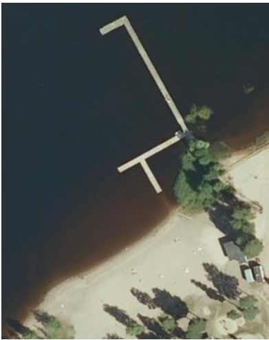
Uimaveden laadun seurantapiste