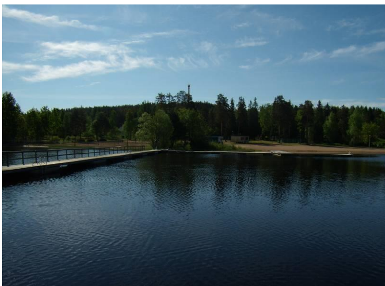
Näkymä laiturilta rannalle