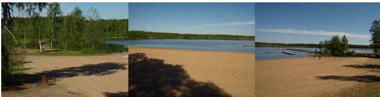
Näkymiä rantavalvojan tuolista otettuna