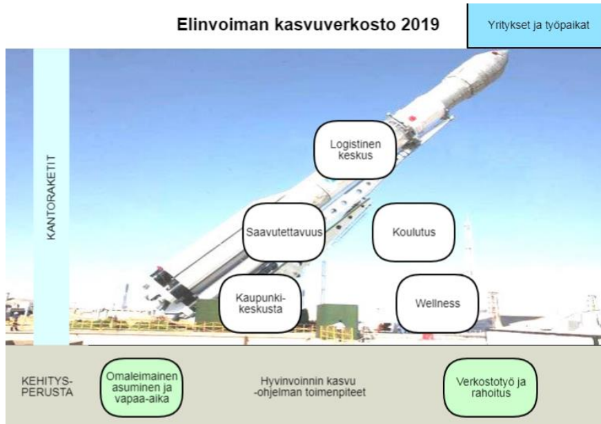
KUVA 1. Kantoraketit nostavat yritykset ja työpaikat kasvuun kehityspenustalta.

välittämiä tekoja. Yhteisen työn tuloksena viisi keskeistä osa-aluetta on tunnistettu ja nimetty viideksi kantoraketiksi 1 , jotka nostavat työpaikat ja elinvoiman kasvuun (Kuva 1):