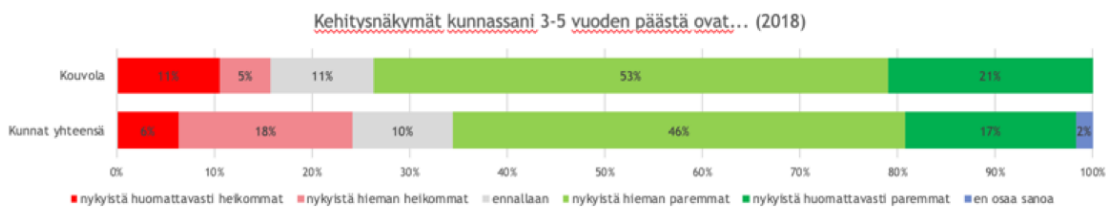
Kuva 2. Kouvolan kehitysnäkymät 3-5 vuoden päähän päättäjien näkemyksen mukaan. 8

Yritykset, järjestöt, viranomaiset, oppilaitokset ja kuntalaiset rakentavat elinvoiman yhdessä. Kaupunki ja kehittämissyhtiö rakentavat yhteisiä toiminta-alustoja kehittämiselle, eli ne rakentavat osallisuutta ja yhteisöjä kokoamalla verkostoja. Tärkeä voimavara on neljäs sektori eli ihmiset itse. Yhteisen tekemisen myötä määrittänyt perinteellistä veto- ja pitovoimaa suurempi tekijä, ns. kipinätekijät (tulevaisuususkon, tahto ja tunne), jotka erottelevat voittajat häviäjistä 2020-luvun aluekehityksessä. Kouvolassa tälle on edellytyksiä, sillä Kouvolan virkamiesjohto ja päättäjät katsovat tulevaisuuteen optimistisemmin kuin kunnissa keskimäärin. Noin kolme neljästä näkee kehitysnäkymät tuleviin vuosiin hieman tai huomattavasti parempina kuin nyt (Kuva 2).