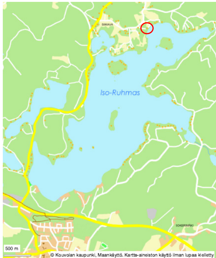
Kuva 1. Suunnittelualueen likimääräinen sijainti Jaalan kirkonkylän pohjoispuolella.

Asemakaava 286 RA6/68 Diaari / TELA 3203/10.02.01/2018