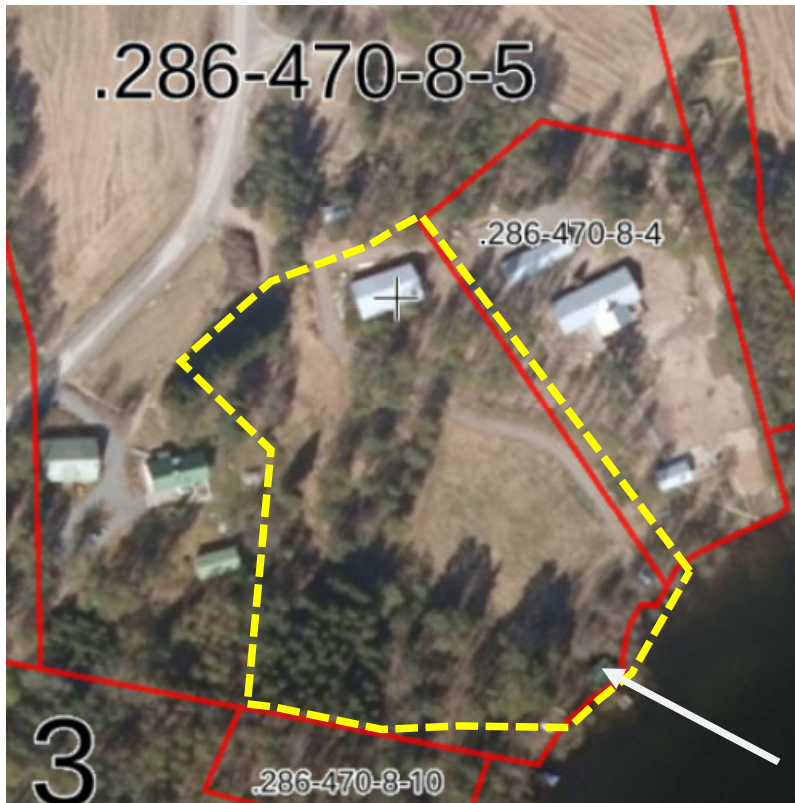
Kuva 5. Kaavan kumoamisen rajaus on merkitty keltaisella katkoviivalla alueen ortoilmakuvaan, nuoli osoittaa saunan paikan. Rajaus poikkeaa hieman nykyisistä kiinteistörajoista vuosien varrella tapahtuneiden tilusjärjestelyjen vuoksi.

Ranta-asemakaavan osittaisen kumoamisen tavoitteena on ajanmukaistaa kaavatilanne vastaamaan olemassa olevaa jo toteutunutta maankäyttöä ja kiinteistönmuodostusta. Alkuperäisessä kaavassa ei ole osoitettu jo vuonna 1952 rakennettua saunarakennusta. Sen jälkeen tapahtunut vesijätön lunastus sekä yleiskaavoitus ovat jo selkeyttäneet omalta osaltaan tilannetta.