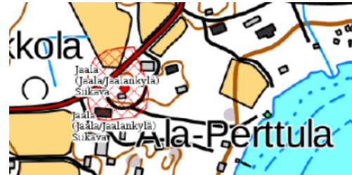
Kuva 5. Muinaisjäännösrekisterin ote

Maakuntakaavassa ei ole mitään suoranaisesti nyt käsiteltävää suunnittelu- aluetta koskevia varauksia. Talouskes- kuksen lähistöllä sijaitseva historiallinen asuinpaikka naapurin puolella, kiinteä muinaisjäännös (Jaala / Jaalankylä, 1000012345) on huomioitu myös maa- kuntakaavassa.