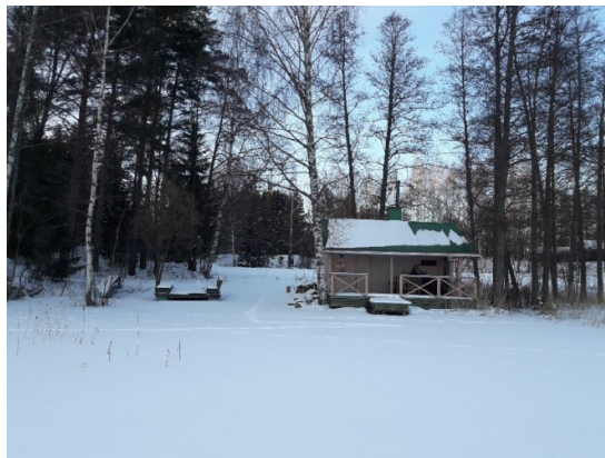
Kuvat 3 ja 4. Näkymä rantaan johtavalta tieltä tilan etelärajalta sekä jäältä rantasaunalle päin.