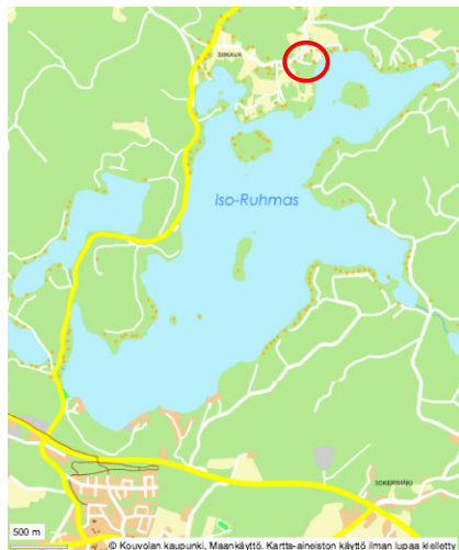
Kuva 1. Suunnittelualueen likimääräinen sijainti Jaalan kirkonkylän pohjoispuolella.

Suunnittelualue käsittää Jaalan Siikavan kylässä sijaitsevan Siikavantien ja Iso-Ruhmaksen rannan välisen Eerolan tilan osa-alueen. Suunnittelualueen pinta-ala on n. 1,25 ha.