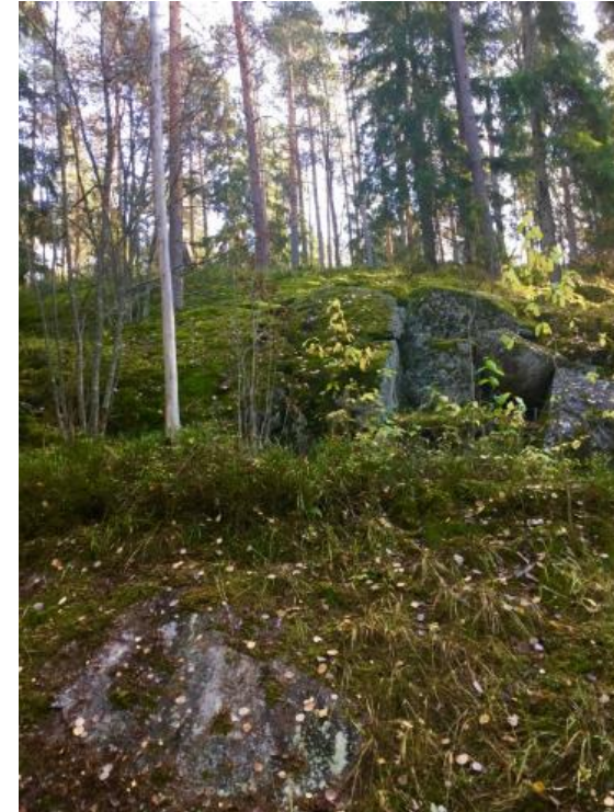
KUVA: Tähteenkadun koulun 8.-9.-luokkalaisista Kettumäen kallio ja sen takana kohoavat kuuset ovat upeita. Onkohan kallioiden välissä koloja? Korkea ja tuulinen paikka saa tuntemaan seikkailunhalua.