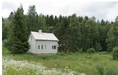
Kuva 7. Hirveläntie 56.