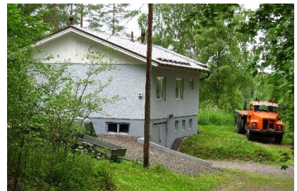
Kuva 11. Brejlinintie 48.