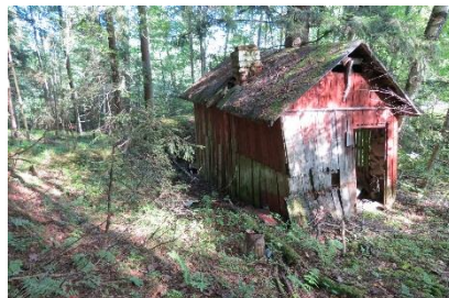
Kuva 10. Hirveläntie 52.