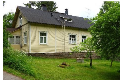
Kuva 4. Brejlinintie 44.