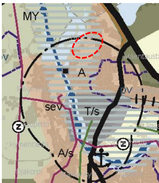
Kuva 12. Ote Kymenlaakson maakuntakaavasta.

Kuusankosken kaupunginvaltuuston 21.5.2007 hyväksymässä Kuusankosken yleiskaavassa 2020 (oikeusvaikutukseton osa) suunnittelualan rakentumattomat osat on merkitty virkistyspalveluiden alueeksi (V). Kaavaan liittyy suunnitelmääräys alueet varataan yleiseen virkistystoimintaan, liikuntapalveluille ja ulkoilukäyttöön. Brejlininpolun päässä oleva venepaikka-alue on merkitty kaavaan kohdemerkinnällä LV. Merkintää on käytetty Kymijoen rannoilla alueilla, joilla on jo olemassa oleva pienveneiden säilytyspaikka tai niiden vesillelaskupaikka. Suunnittelualan jo rakennetut osat on merkitty asuinrakennusten alueeksi (A). Brejlinintien varrella oleva kalliojyrkäne on merkitty arvokkaaksi luontokohteeksi (/s).