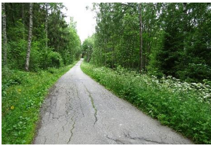
Kuva 2. Näkymä Brejlinintien pohjoisosasta.