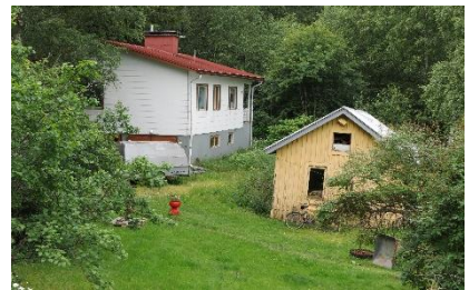
Kuva 8. Hirveläntie 54.