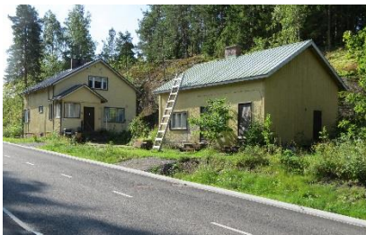
Kuva 6. Hirveläntie 42a.