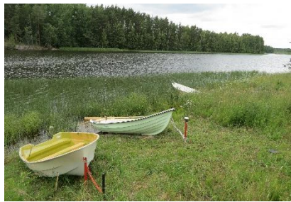
Kuva 3. Näkymä nykyisestä venerannasta.