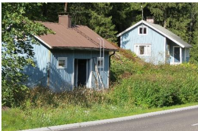
Kuva 9. Hirveläntie 44a.