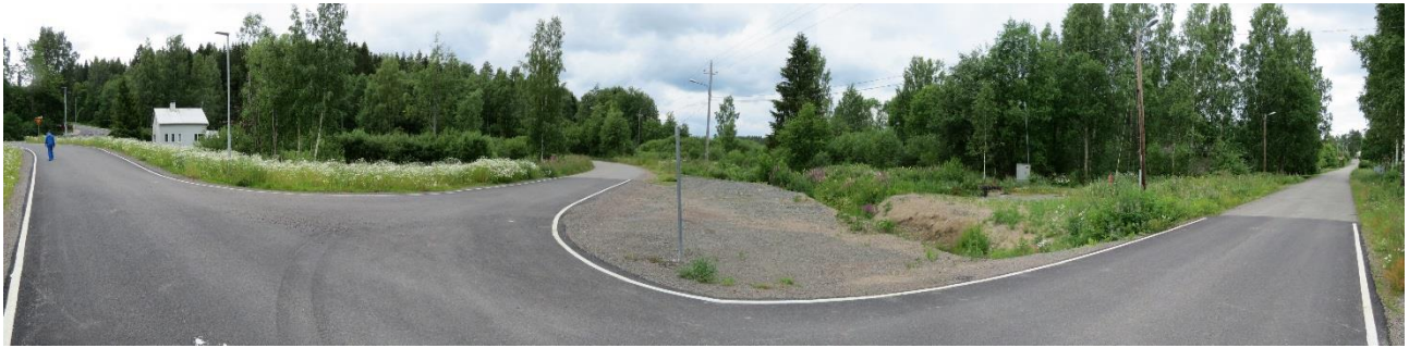
Kuva 5. Näkymä Suurhirventien, Hirveläntien ja Brejlinintien risteysalueelta. Jätevesiviemärin pumpaamoalue on kuvassa oikealla.