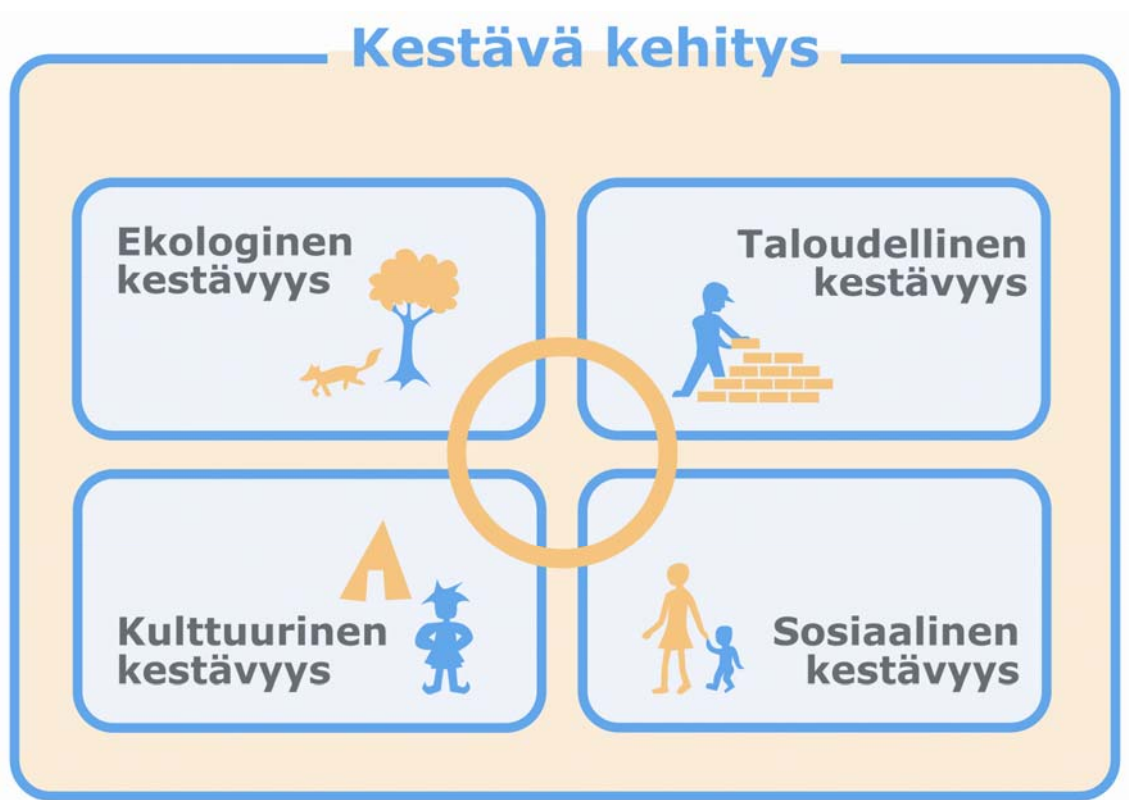
Kuvio 1. Kestävän kehityksen kulmakivet

Kulttuurinen kestävyys on kulttuurisysteemien, kielten ja monipuolisten kansallisten identiteettien, turvaamista ja säilymistä.