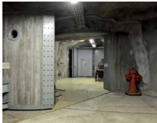
Kuusankosken palomuseon sisääkäynti.