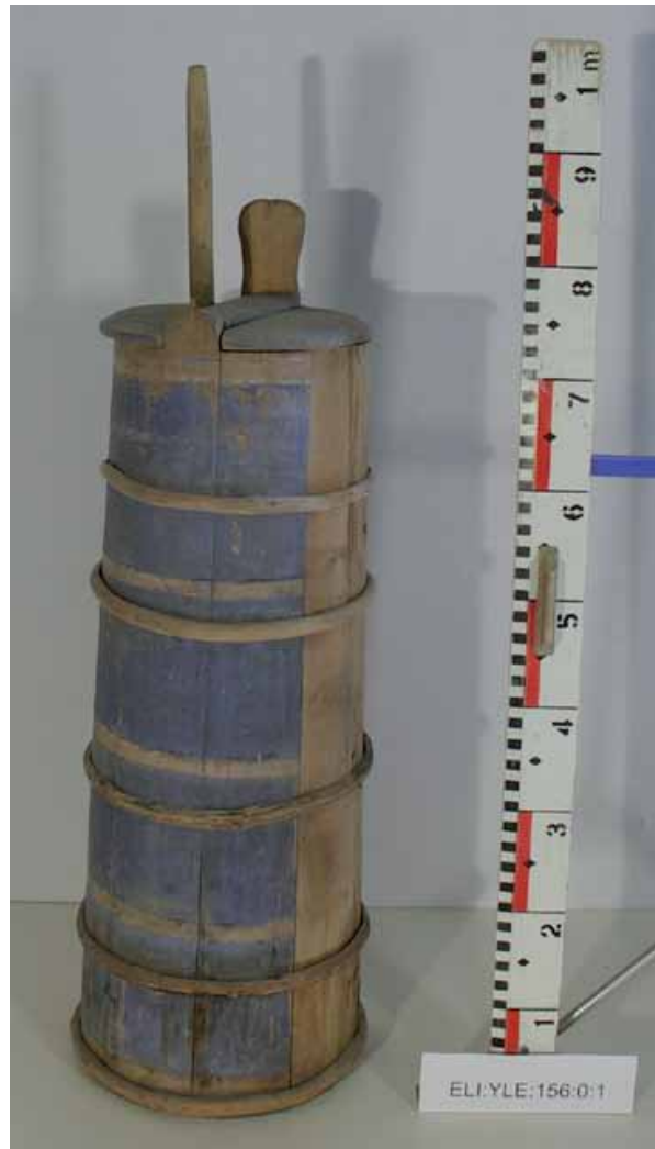
Kirnu. Elimäen kokoelma.

Vuonna 2008 Kouvolan kotiseutukokoelmassa oli 1752 päänumeroa. Esinemäärä on 3940. Kouvolan kokoelma eroaa muista yleiskokoelmista sisältönsä puolesta. Kokoelmiin on luetteloitu erittäin paljon arkistoaineistoa (981 kpl), kirjoja (456 kpl) ja valokuvia (547 kpl). Valokuvat on aikoinaan siirretty valokuva-arkistoon, jossa ne numeroidaan uudestaan. Valokuvat voidaan poistaa esinekokoelmasta. Kouvola-seuran aikaisista luetteloinneista 731 esineelle pitäisi antaa uusi numero ja selvittää, onko esine jo mahdollisesti luetteloitu uudelleen. Arviolta kokoelmiin kuuluu noin 1000 luettelomatonta esinettä. Kokoelmaan on luetteloitu myös noin parikymmentä Rautatiemuseolta vuonna 1957 lainaksi saatua esinettä, joita ei vielä kaikkia ole palautettu takaisin Rautatiemuseoon, koska niitä ei ole pystytty tunnistamaan. Kouvolan kotiseutukokoelmassa on esineitä liittyen rautatiehistoriaan ja rautatieläisyyteen (108) sotilashistoriaan (183), lähialueiden kartanokulttuuriin (Kouvolan, Kirjokiven, Kallioisten ja Oravalan kartanot), talonpoikauskulttuuriin sekä paikkakunnan yritystoimintaan. Oman kokonaisuutensa muodostaa suutari Hirvosen suutarinverstaan esineistö (108 kpl). Vanhimmat esineet ovat 1700-luvulta, uusimmat 1950-luvulta. Ajallisesti painottuvat 1800- ja 1900-luvun vaihteen esineistö.