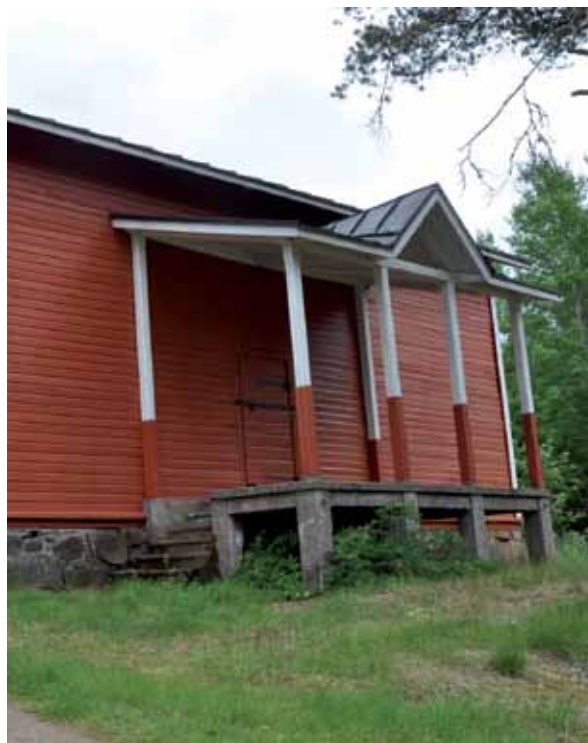
Sippolan viljamakasiini.