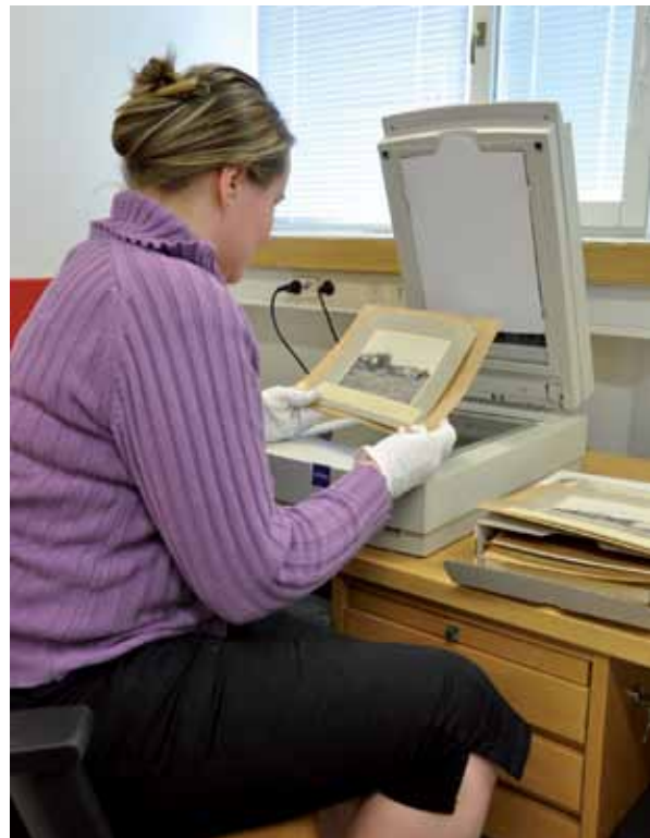
Kuvien skannaaminen.

Vuosina 2011–2012 laaditaan digitointisuunnitelma, missä pyritään arvottamaan kuva-aineisto sekä erottamaan ensisijaista digitointia vaativa aineisto.